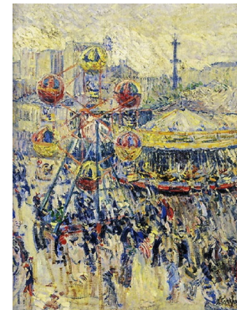
Рис. 7. Пространство Вернадского: «Карусель на Монпарнасе» Н. Тархова

В интегральной концепции В. Вернадского пространство — биотехно-социо-сфера, представляющая синтез живой, неживой, духовной и социальной материи, своего рода симфония жизни. Движущей силой при этом является биологическая энергия, исходящая от человека как ключевого элемента биосферы. Такая энергия проявляется как в циклическом, так и в линейном движении материи, что приводит к спиральной эволюции развития 1 . Роль иллюстрации может в определенной степени сыграть картина Н. Тархова «Карусель на Монпарнасе» (рис. 7).