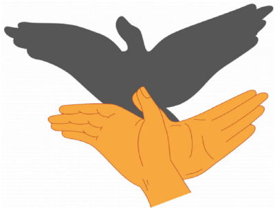
Рис. 4. Пространство Аристотеля: театр теней

В классической механике И. Ньютона пространство рассматривается как пустота, заполняющая промежутки между телами. Время абсолютно, неизменно, независимо, едино для всех точек пространства и всех наблюдателей. Пространство и время здесь образуют однородную среду, в которой выделенными направлениями считаются горизонталь и вертикаль, что дает возможность измерения расстояния и длительности. Иллюстрацией такого представления о пространстве может служить картина К. Малевича «Черный квадрат» (рис. 5).