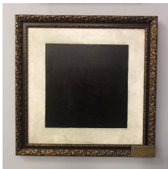
Рис. 5. Пространство Ньютона: «черный квадрат»

В классической механике И. Ньютона пространство рассматривается как пустота, заполняющая промежутки между телами. Время абсолютно, неизменно, независимо, едино для всех точек пространства и всех наблюдателей. Пространство и время здесь образуют однородную среду, в которой выделенными направлениями считаются горизонталь и вертикаль, что дает возможность измерения расстояния и длительности. Иллюстрацией такого представления о пространстве может служить картина К. Малевича «Черный квадрат» (рис. 5).