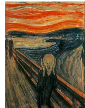
Рис. 6. Пространство Эйнштейна: «Крик» Э. Мунка

По А. Эйнштейну, пространство представляет собой поле взаимного влияния материи и энергии, искривляющего геометрию пространства-времени. Ни пространство, ни время не являются абсолютными и независимыми. Единственной константой является скорость света, используемая для измерения расстояний между неподвижными объектами. В качестве иллюстрации такого представления мы выбрали картину Э. Мунка «Крик», где искривление пространства и относительность времени находят, как кажется, адекватное визуальное выражение (рис. 6).