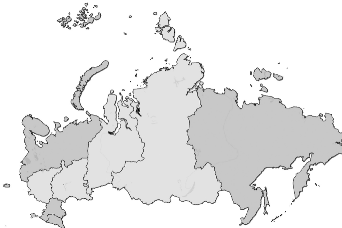
Рис. 4. Тепловая карта системной сбалансированности экономики России в разрезе федеральных округов за 2016 г.

ектом является г. Москва, в Северо-западном федеральном округе — г. Санкт-Петербург, в Южном федеральном округе — Краснодарский край и Ростовская область и т. д. Данная ситуация говорит о существенном дисбалансе в распределении ресурсов. Можно предположить,