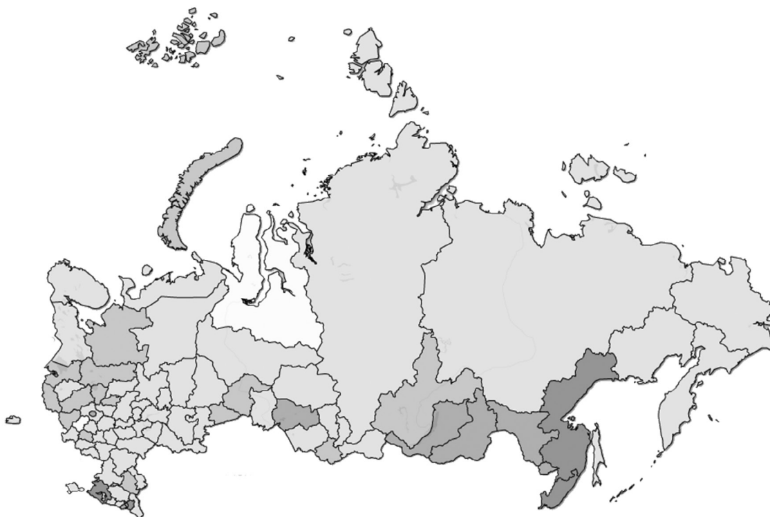
Рис. 3. Тепловая карта системной сбалансированности экономики России в региональном разрезе за 2016 г.