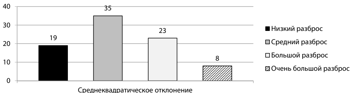
Рис. 6. Распределение субъектов РФ по группам в зависимости от значений среднеквадратических отклонений индексов системной сбалансированности за период с 2012 г. по 2016 г.

ектов РФ. Проведем оценку разброса значений индекса системной сбалансированности субъектов РФ по годам, рассчитав их среднеквадратические отклонения за период с 2012 по 2016 гг. Выделим четыре группы субъектов в зависимости от степени разброса значений среднеквадратических отклонений их индексов системной сбалансированности: