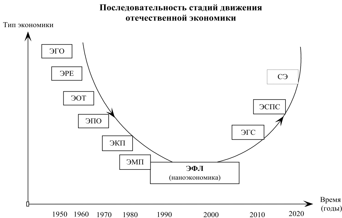
Рис. 3. Последовательность этапов изменения субъектной архитектуры отечественной экономики (вариант 2017 г.)

Приблизительное распределение этих этапов во времени приведено на рис. 3.