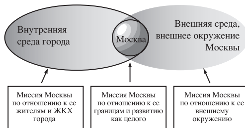
Рис. 2. Системные составляющие миссии.

системы (см. рис. 2). Миссия должна входить в качестве самостоятельного документа (самостоятельного раздела) в комплект документов стратегического планирования и удовлетворять следующим требованиям: