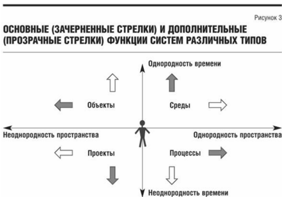
Рис. 3. Основные (зачерненные стрелки) и дополнительные (прозрачные стрелки) функции систем различных типов

товары, выпускаемые предприятием. Это дополнительная функция. Средовые системы увеличивают однородность и времени (основная функция), и пространства (дополнительная), поскольку создают условия для распространения импульсов и потоков между экономическими агентами. Работа процессных систем способствует однородности пространства, поскольку реализует движение потоков от одной точки пространства к другой (основная функция) и одновременно уменьшают однородность времени (дополнительная функция). Проектные же системы делают и пространство, и время менее однородными, чем они были ранее. Например, строительство завода меняет и пространственную структуру, и делает день пуска нового завода не похожим на соседние дни.