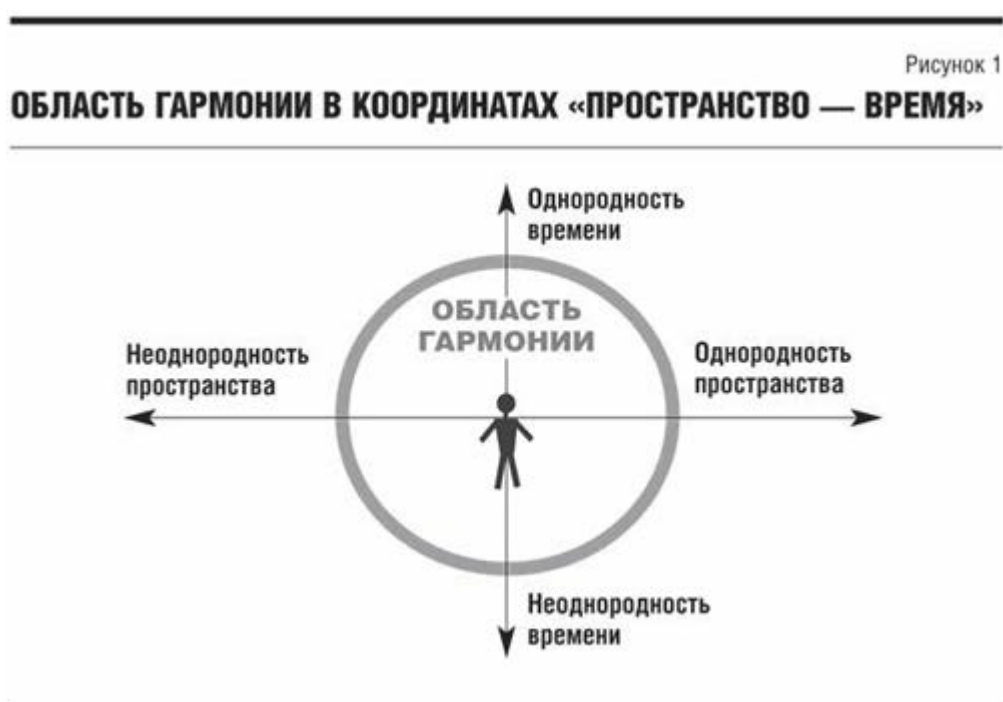
Рис. 1. Область гармонии в координатах «пространство – время»

Можно ввести систему координат, отражающую степень изменчивости условий деятельности в пространстве и во времени (рис. 1). Вертикальная ось показывает степень неоднородности времени, горизонтальная – пространства для субъектов экономической деятельности. Точкой пересечения осей и нулевым отсчетом по обеим осям естественно считать наиболее комфортную для обычного человека степень неоднородности времени и пространства. В этом пространстве на рис. 1 символически изображена условная «область гармонии» для нормального экономического субъекта.