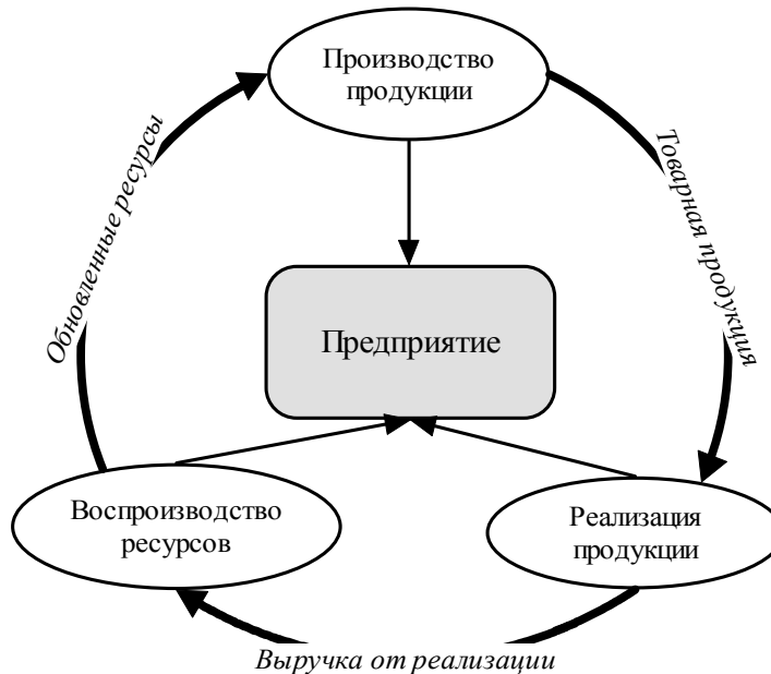
Рис. Предприятие как единство трех основных хозяйственных процессов

Таким образом, взгляд на предприятие как принципиально анизотропную систему сменяется здесь ее более или менее изотропным рассмотрением, в каком-то смысле близким к средовому подходу.