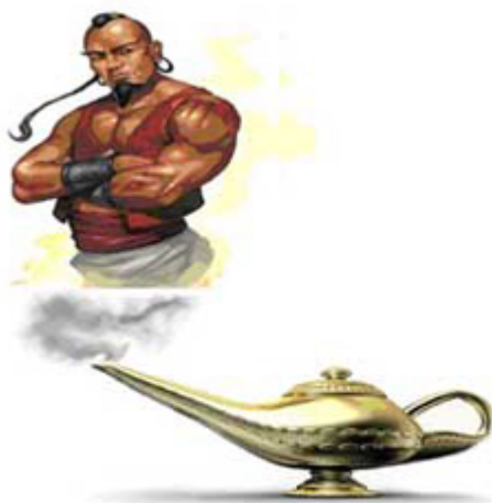
Рис. 1. Кризис как образ: джинн из сосуда

Каждый из основных элементов картинки на рис. 1 имеет свою экономическую интерпретацию. Сам джинн символизирует кризис. Дым и пламя, с которыми связывается в мифологии появление джинна из сосуда, имеют аналог в современной экономике в виде информационно-экономической среды, реализующей связи между агентами рынка, а также между ними и обществом. Важность этого элемента в системе экономических отношений трудно переоценить. В реальности эта среда оказалась не просто нетранспарентной, но и искажающей информацию. Деятельность многочисленных консалтинговых, аудиторских и рейтинговых агентств, призванных объективно информировать общество о состоянии корпораций, оказалась крайне неэффективной и во многом подорвала структуру отношений взаимного доверия в системе «индивид – предприятие (фирма) – государство». Что же касается третьего основного элемента – сосуда, в котором до поры скрывается джинн, то это – обобщенный образ предприятия, откуда и пошли трещины, превратившие мировую экономику в поле развития кризиса.