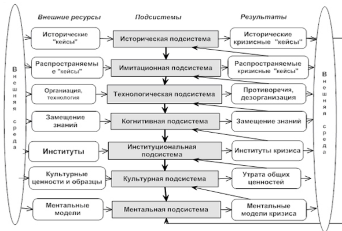
Рис. 3. Структура кризиса как системы и производство «токсичных» продуктов

Кроме того, проникновение «кризисогенной» системы внутрь организации вызывает репликацию – размножение кризисной системы внутри организации.