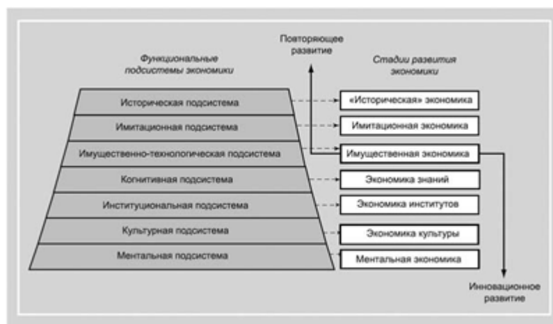
Рис. 3. Основные возможные направления и стадии развития страновой экономики

Если говорить о первом пути - пути самостоятельного инновационного развития, то в это направление объединяются варианты, связанные с ценностями продуктов деятельности подсистем, расположенных ниже доминирующей в настоящее время имущественно-технологической подсистемы. Можно предположить, что стадии развития будут возникать в соответствии с последовательностью подсистем в "сэндвич-пирамиде" (рис. 3).